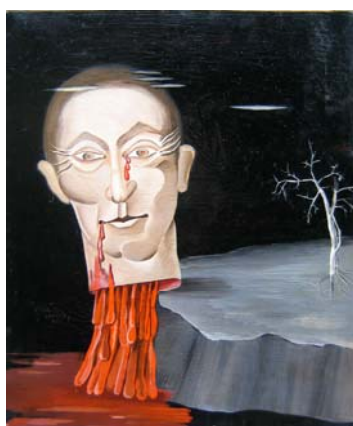
Le poète Benjamin Fondane par Victor Brauner. 1931.

Coll. MNAM, Bibliothèque Kandinsky, Centre Georges-Pompidou, Paris. Fonds Brancusi.