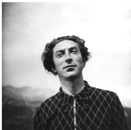
Benjamin Fondane vers 1935.

Tirage effectué à partir d'une plaque de verre.