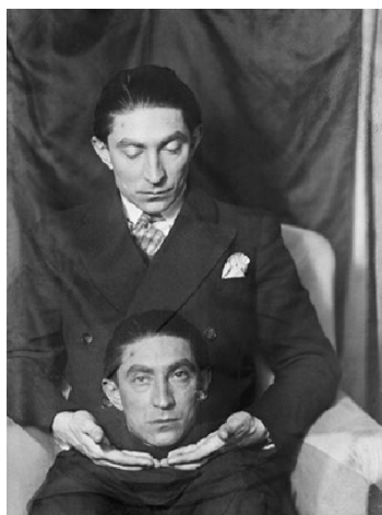
Portrait de Benjamin Fondane par Man Ray. 1928.