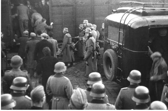
Rafle des Juifs de Marseille, janvier 1943