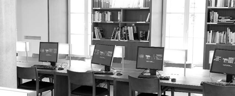
Salle de lecture du Mémorial de la Shoah / CDJC