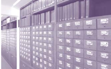
Le fichier papier du CDJC