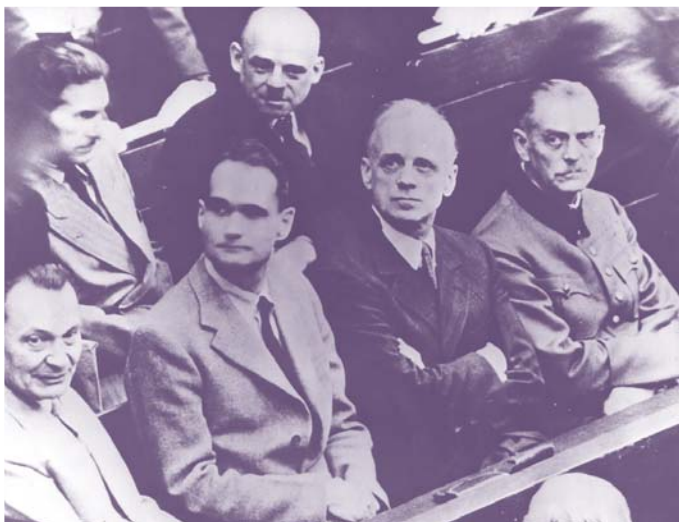
Les accusés Göring, Hess et Sankel dans la salle d'audience du tribunal international de Nuremberg, 1945.