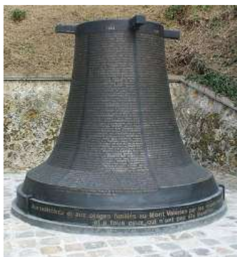
Monument à la mémoire des résistants et otages fusillés au Mont Valérien.