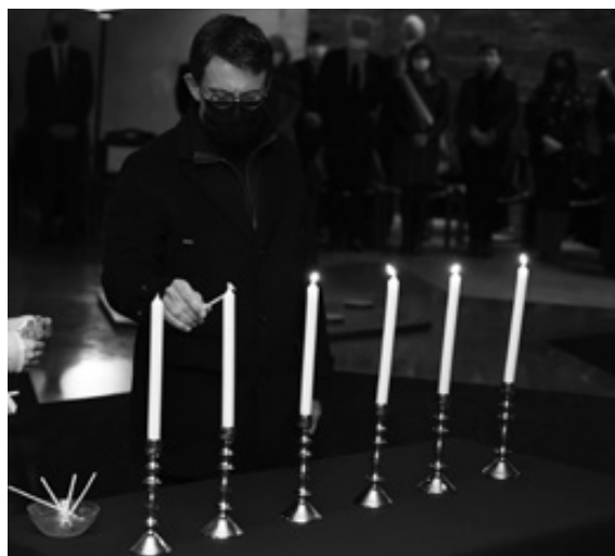
De haut en bas : Anne Hidalgo et Manuel Valls se recueillent.