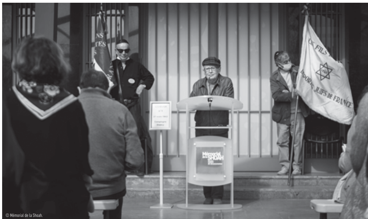
Cérémonie à la mémoire des déportés du convoi 1 (27 mars 1942)