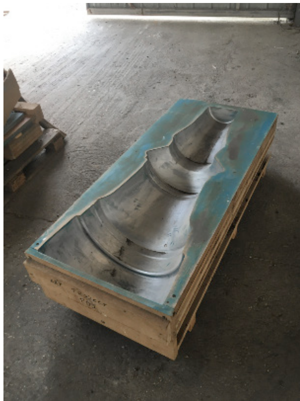
STREETLIGHTS OF MEMORY — WOOD MOLDS - 2023 © Melik Ohanian ADAGP, Paris 2023

Elle reçoit en 2019 le Prix Visarte à Zurich.