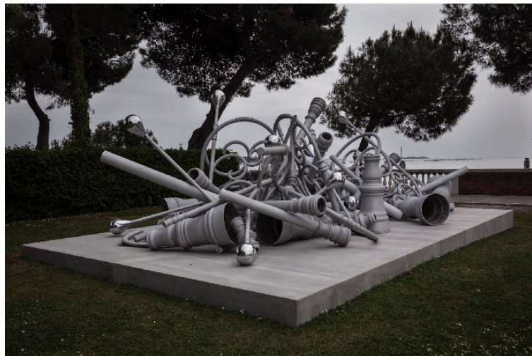
STREETLIGHTS OF MEMORY - A STAND BY MEMORIAL, 2010/2015 © Melik Ohanian ADAGP, Paris 2023

1 ère séance à 18h30, présentée par Melik Ohanian Puis projection du film en continu jusqu'à 2h du matin, nuit du 3 au 4 juin.