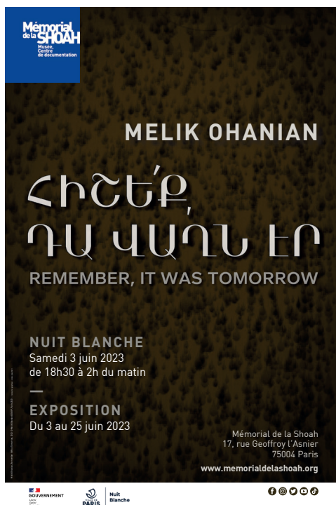
Affiche de l'exposition. Melik Ohanian, Remember It Was Tomorrow , 2023 © Melik Ohanian ADAGP, Paris 2023

Dans le cadre de la Nuit Blanche 2023, le Mémorial de la Shoah invite l'artiste plasticien Melik Ohanian à montrer un ensemble d'œuvres, réunies pour la première fois et dans une configuration inédite, évoquant le génocide des Arméniens. La proposition s'articule autour de trois œuvres majeures, un documentaire et une projection extérieure, pour rendre hommage aux victimes de ce génocide.