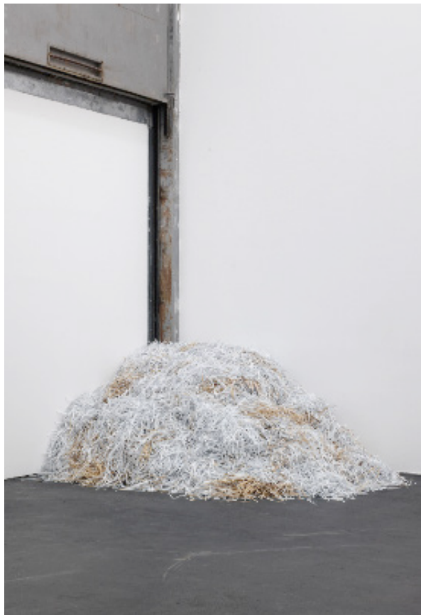
PULP OFF - 2014

Il invite à perpétuer ce témoignage et son analyse comme un élément constitutif de l'identité d'un peuple. Avec Pulp Off , Melik Ohanian offre aux visiteurs l'occasion de découvrir un témoignage hors du commun (dont l'original est entré au Département des Manuscrits de la BnF en 2022) et le repousse hors de l'oubli.