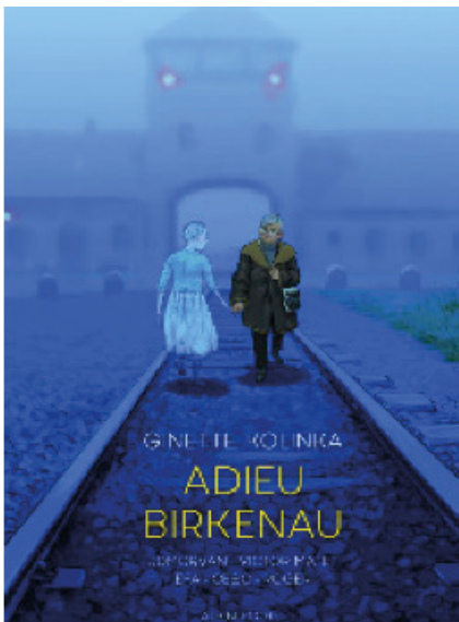
Photo : Couverture de la BD Adieu Birkenau. L'histoire de Ginette Kolinka, survivante d'Auschwitz. © Éditions Albin Michel.

15h30 - Départ depuis Paris. Rdv au Mémorial de la Shoah, Paris 16h15 - Arrivée au Mémorial de Drancy 16h30 - Visite du Mémorial de Drancy 17h - Visite de l'exposition en présence de Ginette Kolinka 18h - Départ pour Paris 19h30 - conférence autour de la BD de l'exposition Mémorial de la Shoah, Paris