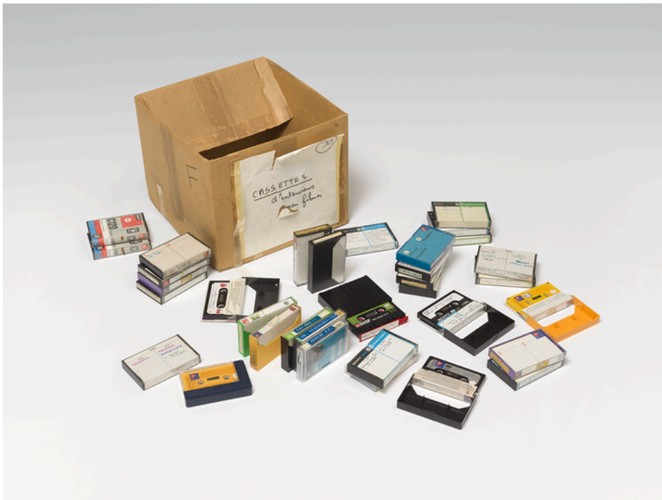
Cassettes audio de la collection Lanzmann ; Musée juif de Berlin

Claude Lanzmann décède le 5 juillet 2018 à Paris, le lendemain de la première de son dernier film, Les quatre sœurs .