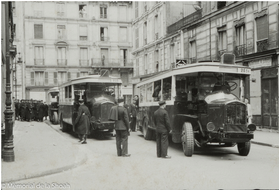
Les hommes arrêtés sont transférés à la gare d'Austerlitz par des bus français réquisitionnés.