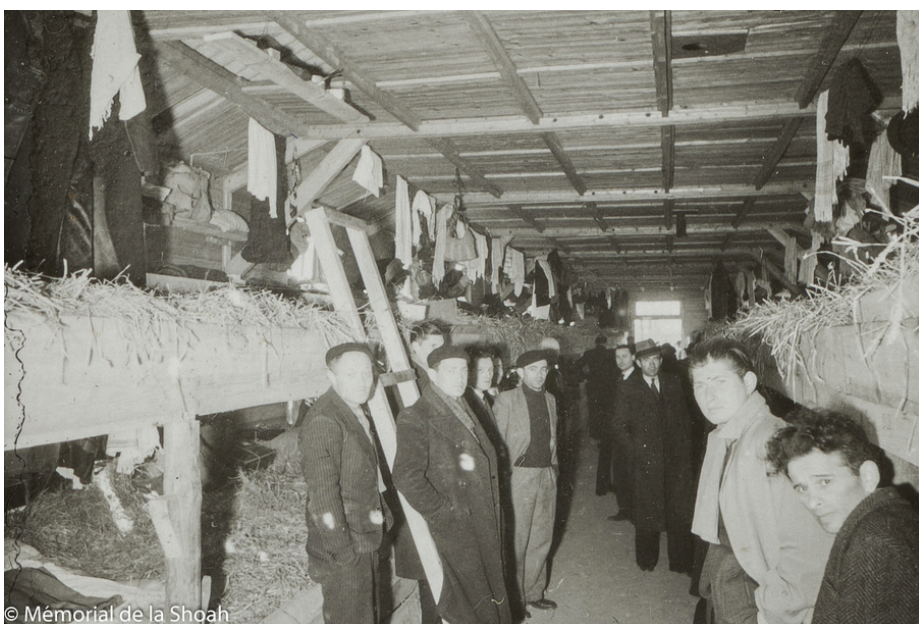
Les photos sont prises le lendemain de la rafle au camp de Pithiviers et Beaune-la Rolande Les hommes doivent s'installer dans des baraques froides et insalubres, en construction. La paille qui servira de matelas dans les châlits est encore à l'extérieur des baraques.