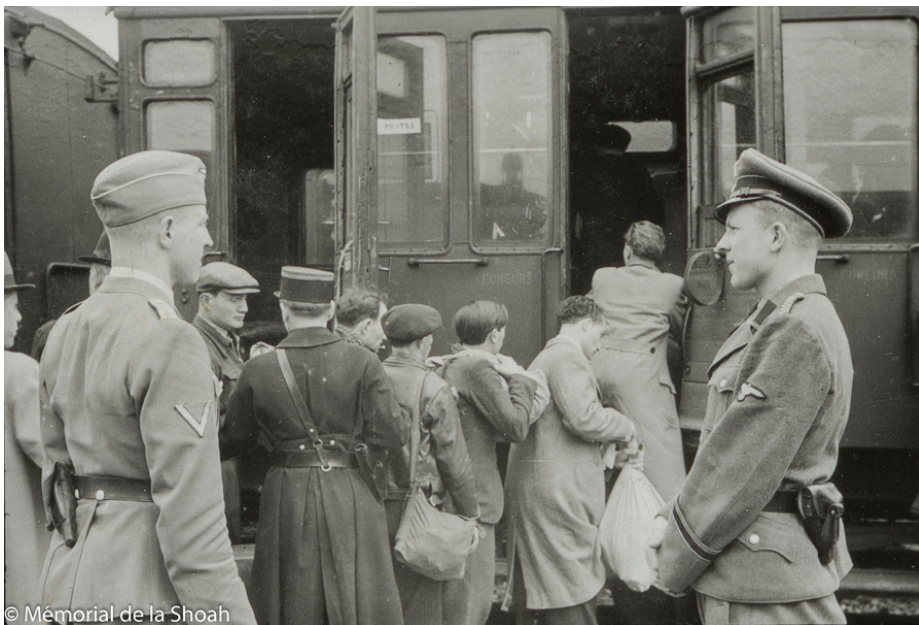
Theodor Dannecker surveille le transfert des Juifs raflés à la gare d'Austerlitz. Sa présence sur les photos dans cette rafle, montre qu'il a suivi et supervisé tout le déroulé de la rafle.